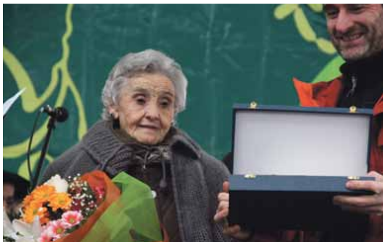
San Blas azokan urtero omentzen dute baserri-bizimodua. aiaraldea.eus