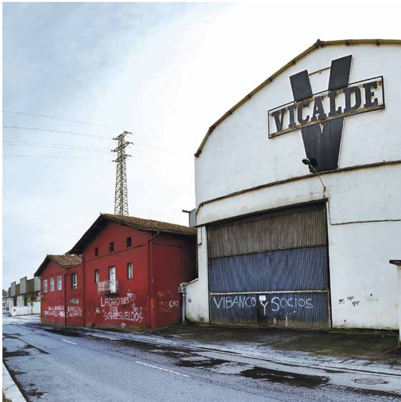
Enpresa txiki eta ertainak izan dira krisi ekonomikoagatik kaltetuenak.

Dena dela, Aiaraldeko industria-erikiko "abantaila handi bat" duela ziurtatu du Erraztik: Langile pres-