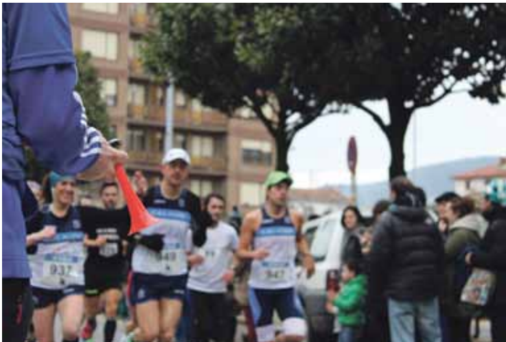
Dozenaka korrikalarik hartu zuten parte lasterketan