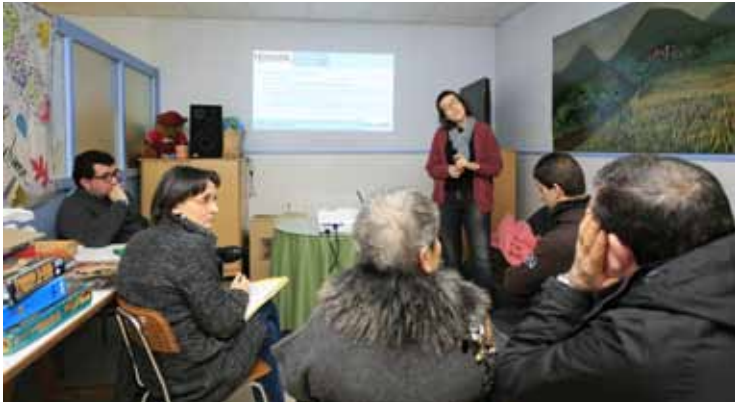
Alkinarreko auzokideekin batzarra.