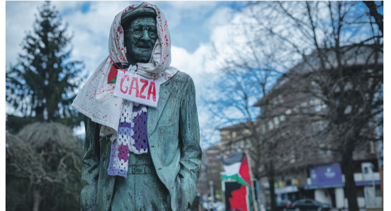
Ekimen herritarrek Israelen aurkako boikoterako deia luzatu du. Aiaraldea.eus