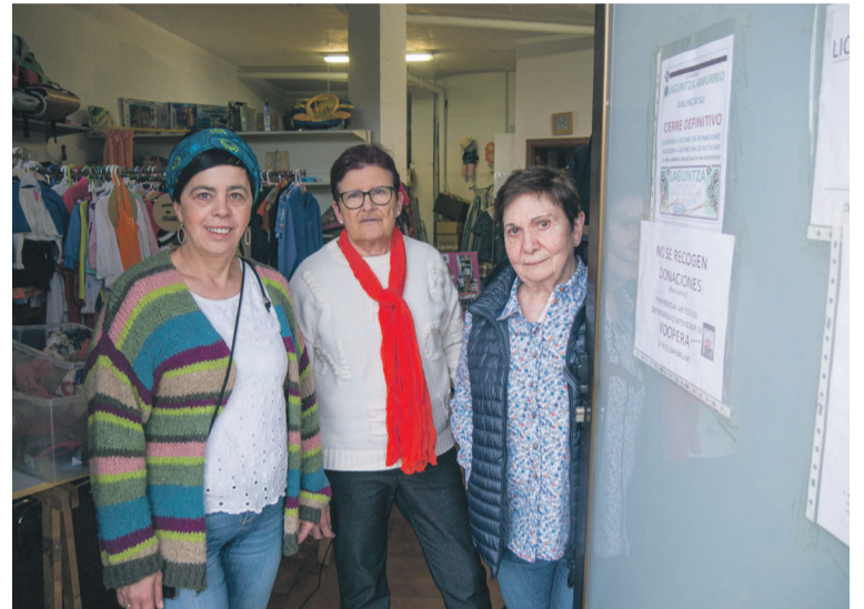
Laguntzako hiru kide elkarteak duen arropa biltegian. Aiaraldea.eus

Aiaraldea Komunikabideak Laguntza elkarteko zein Udaleko ordezkariak elkarrizketatu ditu, eta Aiaraldea.eus atarian irakurri daitezke biak osorik.