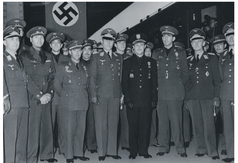
Guda Zibilean Otxandio bonbardatu zuen Urduñarrak, eta 1941ean naziekin batera jo zuen Sobietar Batasunaren aurka. EITB; Jose Fiant; Francisco Franco Fundazioa