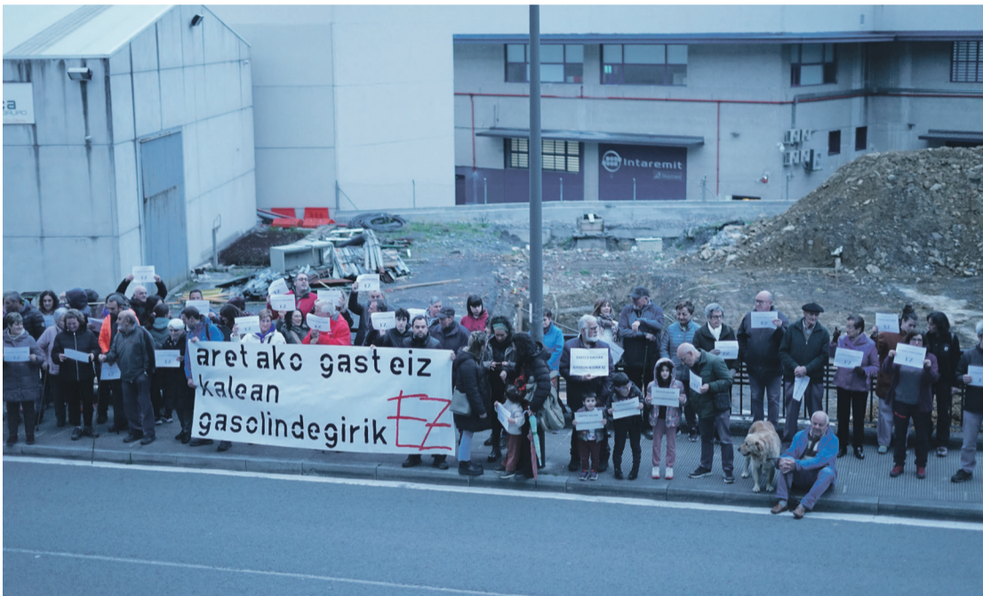
Elkarretaratzea egin zuten bizilagunek obrak bertan behera uztea eskatzeko.