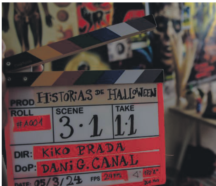
Hiru astez luzatu da filmaren grabaketa. Aiaraldea.eus