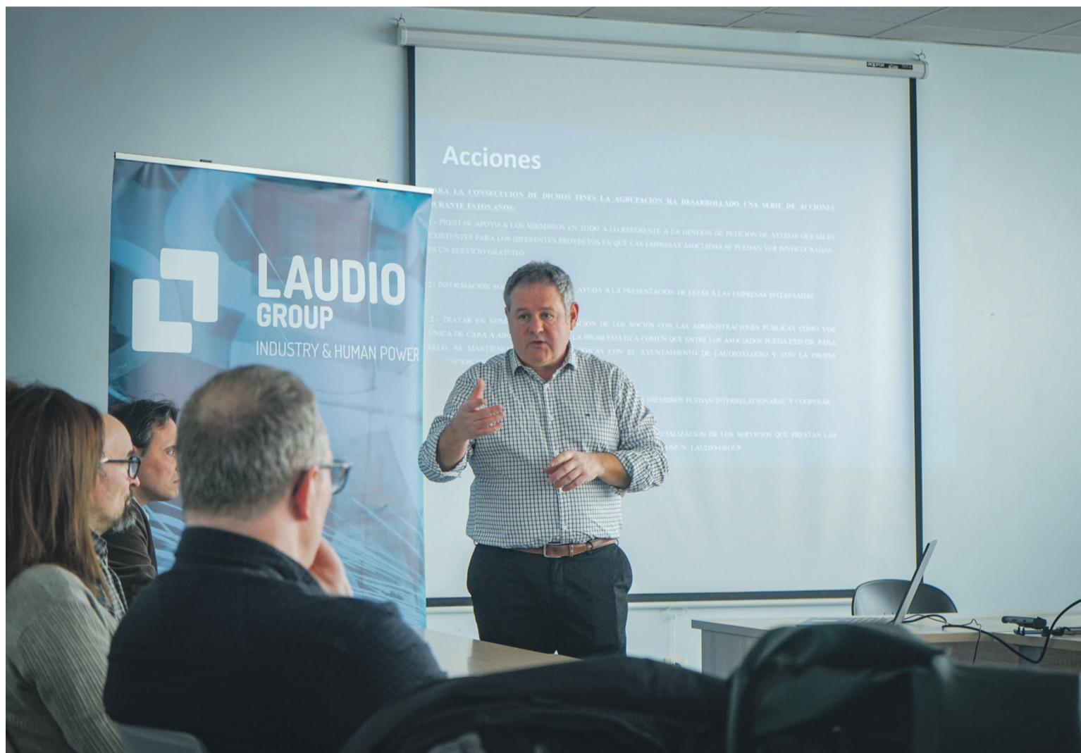
Laudio Groupen jardunaren nondik norakoak aurkeztu zituzten iragan hilabeteetan.