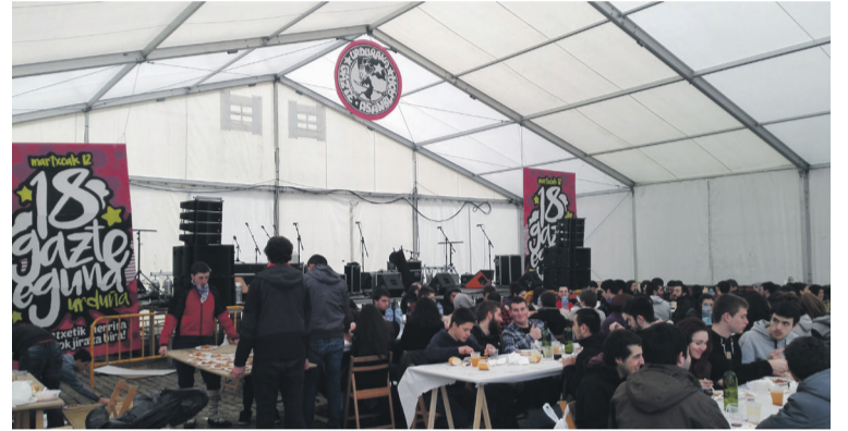
Apirilaren 13an Urduñako 23. Gazte Eguna ospatuko dute. Aiaraldea.eus