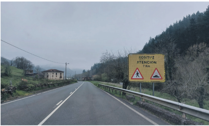
20 konkorrak daude guztira BI-2604 errepidearen Gordexolako zatian. Aiaraldea.eus