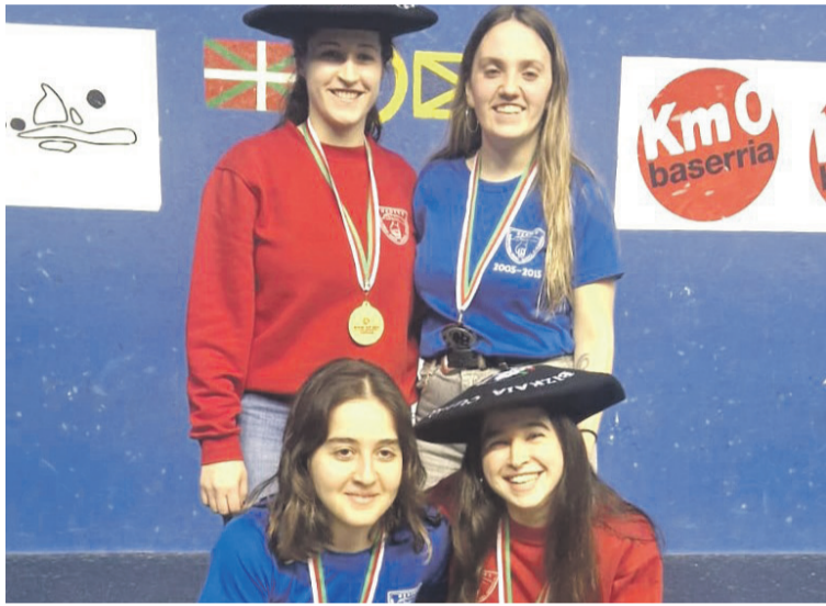
Finalaren ostean egindako argazkia. Olgetan