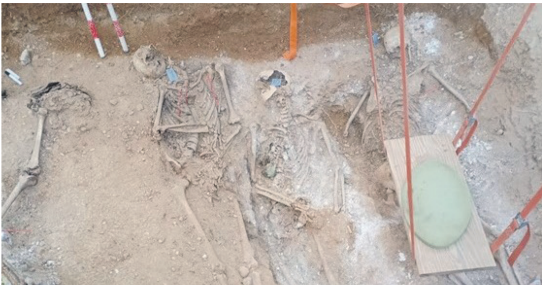
Angel Egañaren gorpuzkiak Valladoliden.