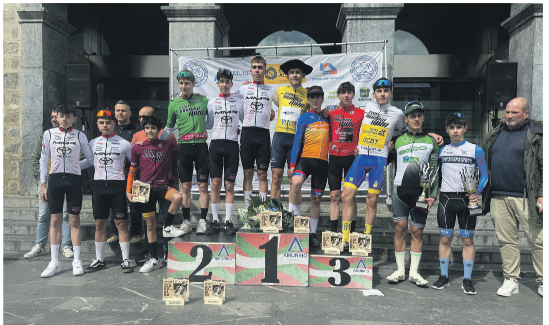
Aiarako Birako liderrak Amurrioko podiumean martxoaren 24an.