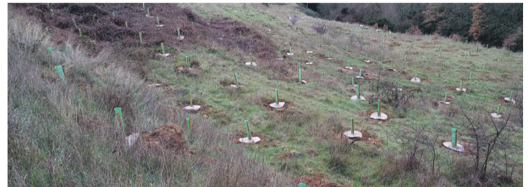
Tokiko espezieak landatuko dituzte. Arabako Foru Aldundia