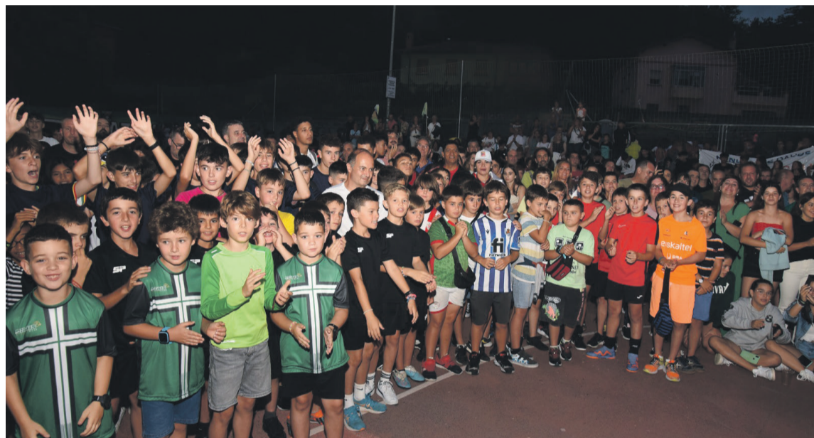
Ehunka parte hartzaile biltzen ditu Ugarteko torneokoak. Antonio Crespo Perez

Uztailak 30etik 2ra luzatuko da egitaraua, eta Jonkass, Tatta, HBN, NØT, Zirkinik Bez eta DJ Pakita Penas igoko dira plazako oholza gainera.