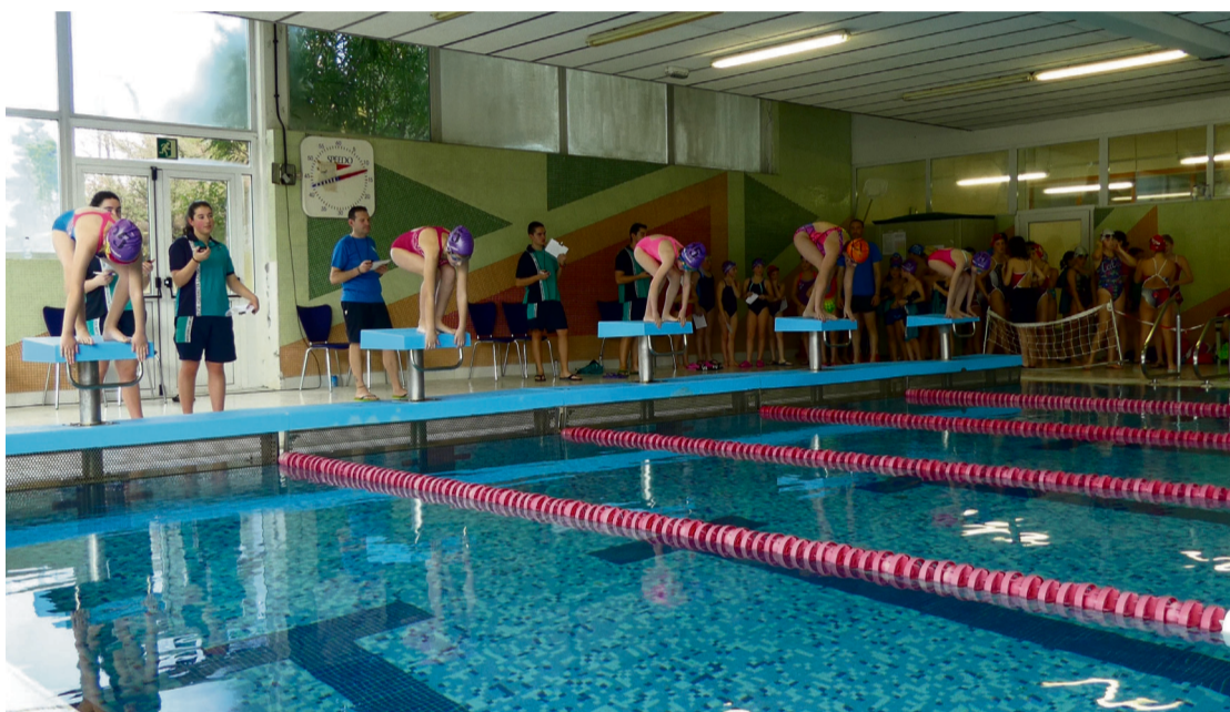
Laudioko Eskolarteko Igeriketa Txapelketa egin zen urtarrilean.

Goizeko 05:30ean esnatu egiten dira eguneroko (astelehenik ostiralera)