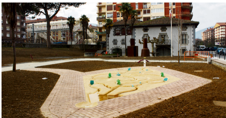
Martxoan amaituko dira obrak.