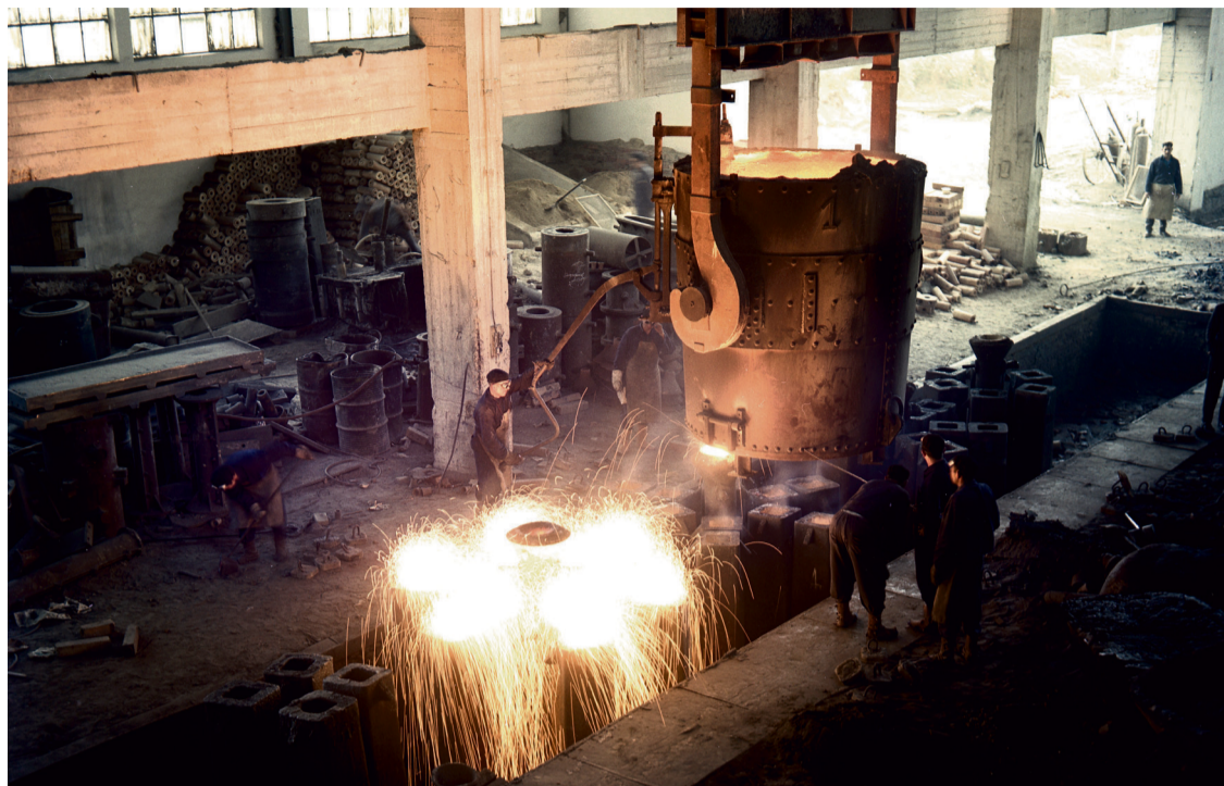
Aceros de Llodio labea, 1960 urtean. Amiantoa erabiltzen zuten beroa isolatzeko

% 5 soilik diagnostikatzen da laneko gaixotasun gisa, amiantoak eragindako minbizia kasuen portzentaia altuagoa bada ere