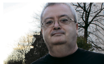
Juanjo Basterra Kazetaria

Omnia udal-talde politikoak gogor kritikatu du udal gobernuaren jarrera. "Ez dira gai izan enpatia erakutsi eta udal gisa zuten erantzukizuna euren gain hartzeko". EAJK, bere aldetik, udalgobernuaren jarrera defendatu eta sententzia "arma" gisa ez erabiltzeko deia luzatu du. Altubek ere salatu du Omniaren jarrera, alderdiak esandakoak "gezur hutsa" direla adieraziaz eta familiaren sufrimendua politikoki baliatu dutela argudiatuta.