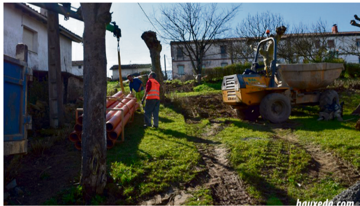
Hasi dira dagoeneko obrak egiten.