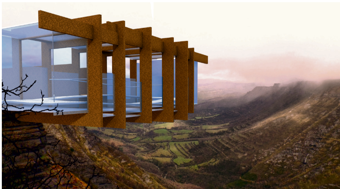
Gaztela eta Leongo Juntak egindako proiektuaren irudia.

Azpiegitura berriak airean egotearen sententzia sortu nahi du, eta horretarako kristalarekin eta "tramex" izeneko materialarekin egingo dute balkoia. Hain zuzen, 200 metrora egongo da behatokia "eskegita", eta ertza zulatuta aterako da amildegira. Eraikinak irisgarritasun irizpideak beteko dituela adierazi dute.