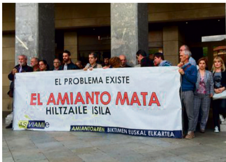
Kepa Galdosen senideek eginiko elkarretaratzea.

la uste du ikertzaileak, "3.000 produktu bano gehiago egiteko erabiltzen zen material hori, oso merkea baitzen". Basterrak ere salatu du Laudioko Udalararen jarrera: "Ez dira gai izan duten arazoari aurre egiteko, estali egin dute". Hala ere, kazetariak nabarmendu du arazo orokortua dela. "Eskualdeko enpresa garrantzitsu guztiek dituzte amiantoarekin erlazionatutako heriotza kasuak", ziurtatu du.