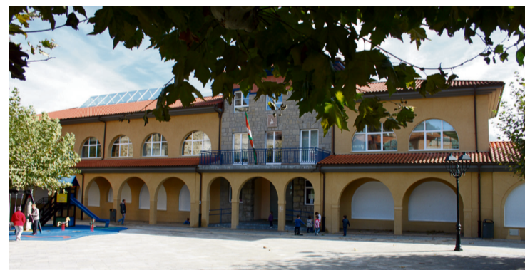
Eskolako eta frontoiko argiteria aldatuko dute.