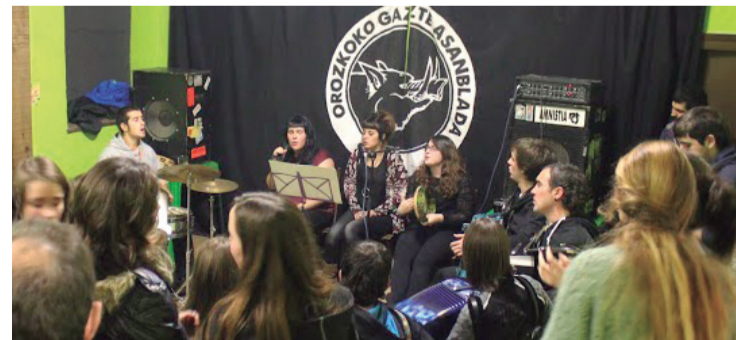
Duela bi urte ireki zuten Jentilzulo kultur gunea.

Bi bazkietza mota plazaratu dituzte, ordainduko eta ez ordain-