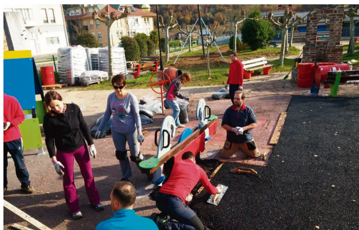
Auzolanean berritu dute haurren jolas gunea.

Lan horiek 15-20 egunen bueltan egitea aurreikusi du elkarrekin. Arabako Foru Aldundiaren 24.900 euroko diru-laguntza bat baliatu dute gurasoek beharrezko material eta tresnak erosteko.