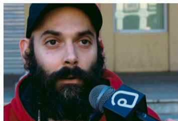
Jabi Fabrikako langilea

Proposatu zuk ere galdera egunkaria@aiaraldea.eus helbidera idatzita.