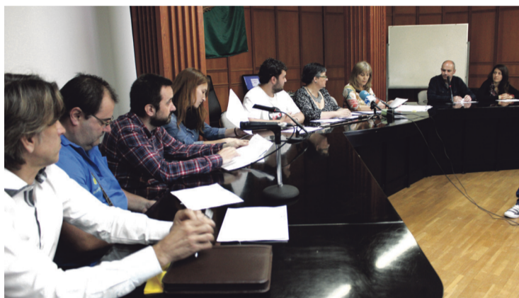
Artziniegako Udal Osoko Bilkura.