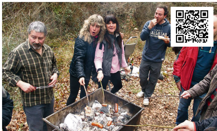
ARGAZKI GALERIA: Kanporamartxo jaia ospatu dute asteburuan Orozkon, Laudion eta Arrankudiaga-Zollon. Mendira jo dute herri horietako hainbat bizilagunek, txitxi-burruntziak prestatutako hamaiketakoak gozatzeko.

Espainiako Kongresuko Sustapen Batzordean jorratu dute Renfeko C-3 linean dauden gabeziak, irisgarritasuna eta segurtasun, bereziki. Alderdi gehienek babestu dute lanak egiteko beharra; eta Gobernuari eskatu diote berauek gauzatzea, Ciudadanosek salbu. EAJK aurkeztu du ekimena eta alderdi politiko orok, Ciudadanosek ezik, bat egin dute C-3, C-2 eta C-1 lineen segurtasuna eta irisgarritasuna hobetzeko eskaerarekin. Leopoldo Barreda PPko ordezkariak azaldu du Arrankudiagako geltokian lanak egikaritu dituztela dagoeneko, eta Urduñako proiektua prestatzen ari direla.