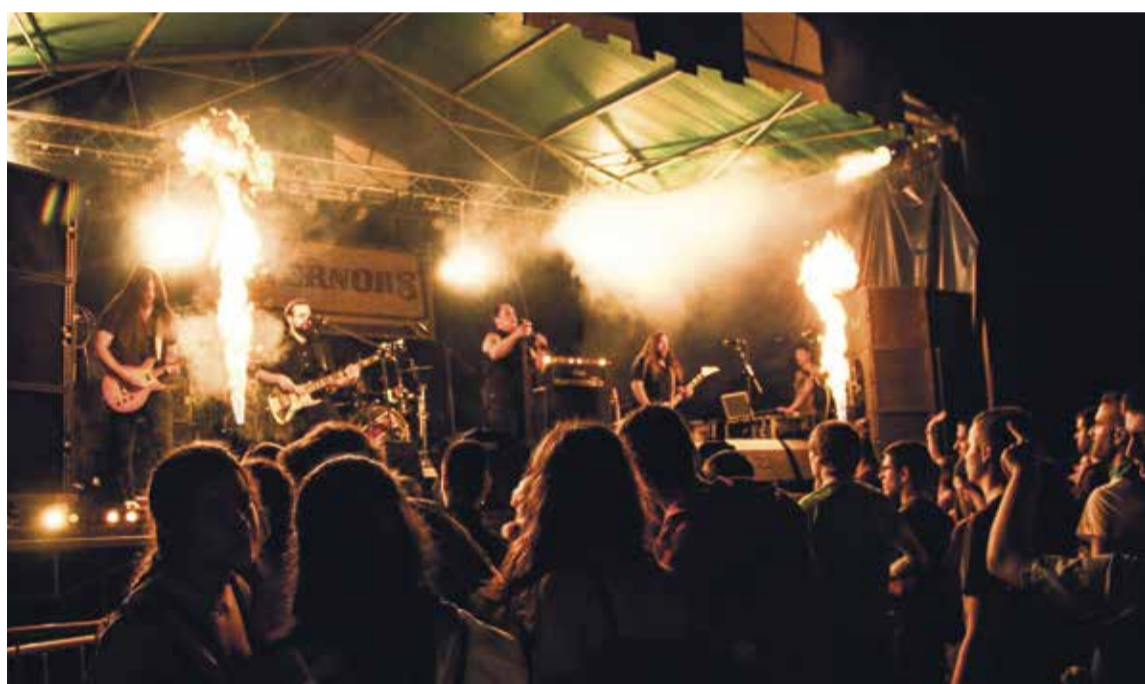
Governors taldeak joko du larunbatean, besteak beste. Zuriñe Alava

Musika eskaintza oparoa egongo da Amurrioko San Jose auzoko jaietan. Sei talde igoko dira guztira oholtzara: Guda dantza, Governors, Dj Ruba, Astarte, Los Vecinos del Callejón eta Dj Markelin. Gaztetxean, aldiz, Tinko, Dantzeta Jarrai, Bad Sound System eta Aiaraldeko Soinu Sistema arituko dira jaia girotzen.