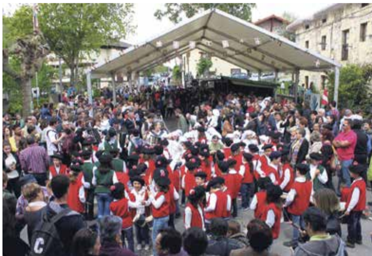
Arespalditza izango da jarduera gehien bilduko dituen tokia. Aiaraldea.eus