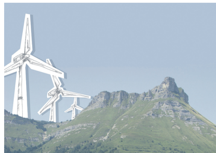
Hogei azpiegitura baino gehiago eraiki nahi dituzte. Aiaraldea.eus