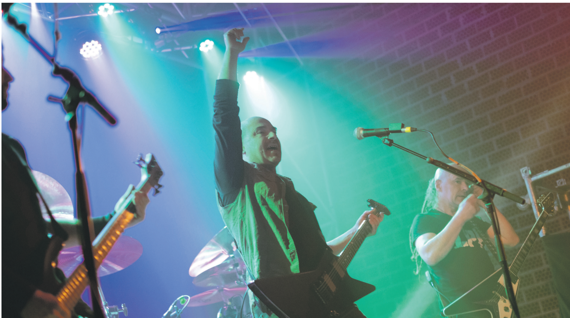
Su Ta Gar Burubioko oholza gainean.