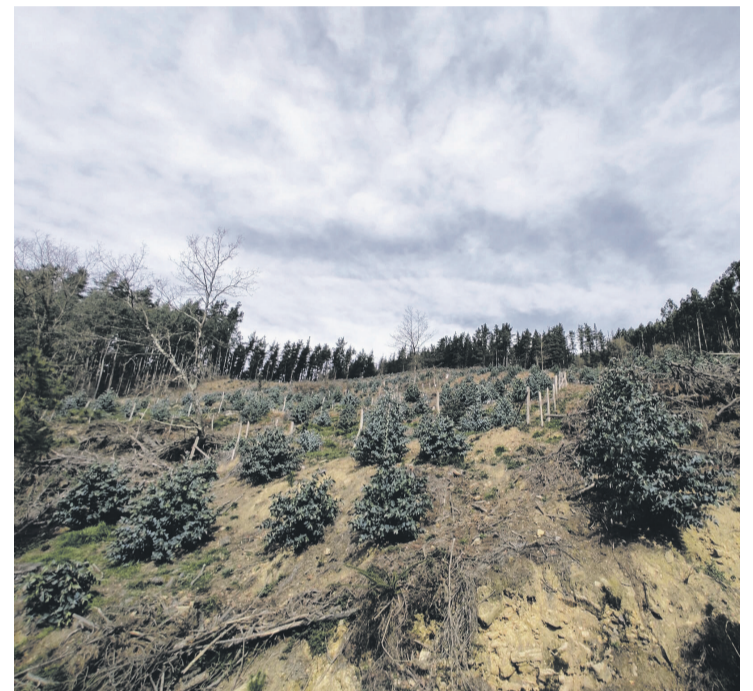
Okupatzen duen azalera hamairu aldiz biderkatu du eukaliptoak.