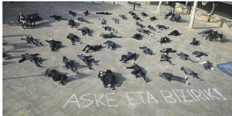
63 emakumek hartu zuten parte ekimenean. Aiaraldea.eus