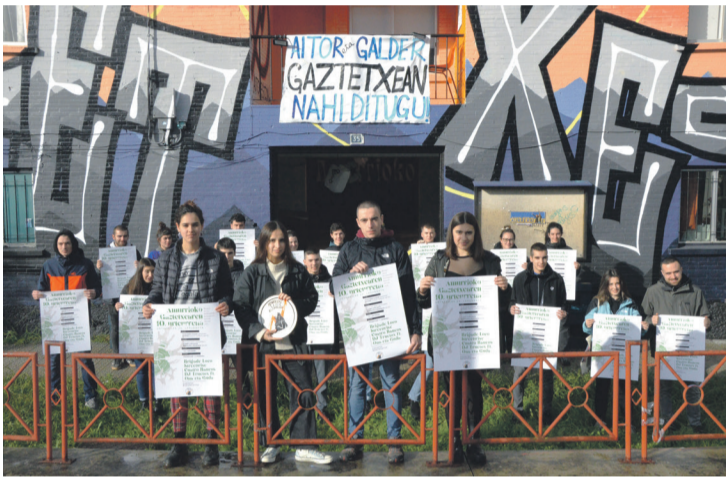
Urtarrilaren 20an ospatuko dute urteurrena. Aiaraldea.eus