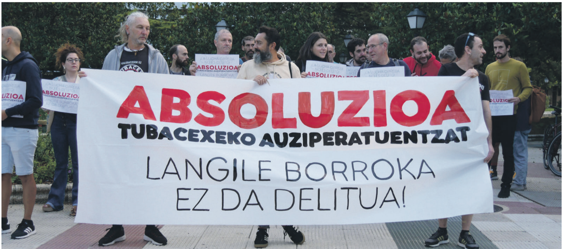
Irailean egingo zuten hiru gazteen aurkako epaiketa, baina hiru hilabetez atzeratu da azkenean. Aiaraldea.eus