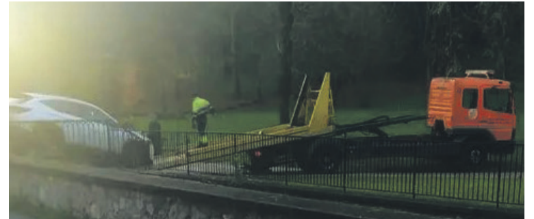
Zubian trabatuta geratu da autoa. Tere Olabarria