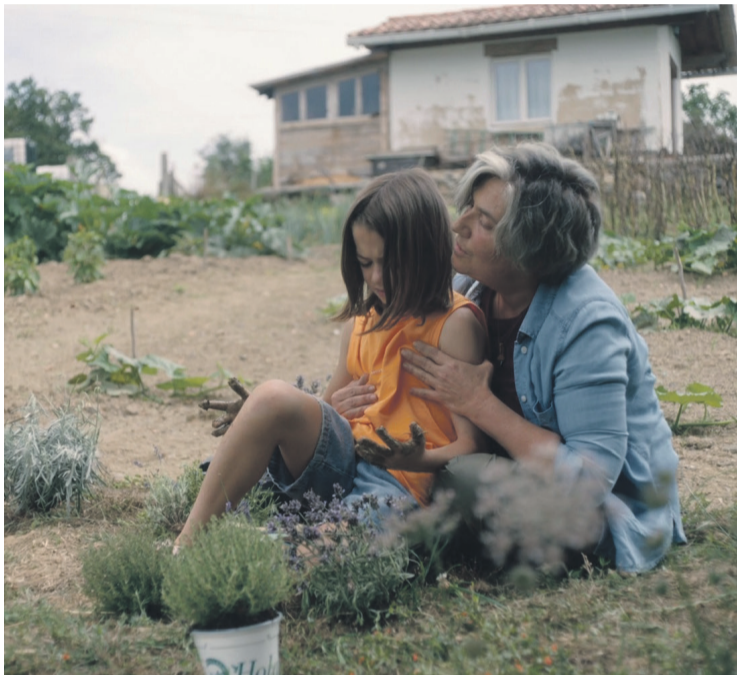
Sari eta aipamen ugari jaso ditu Urresolaren lanak. Sirimiri films.