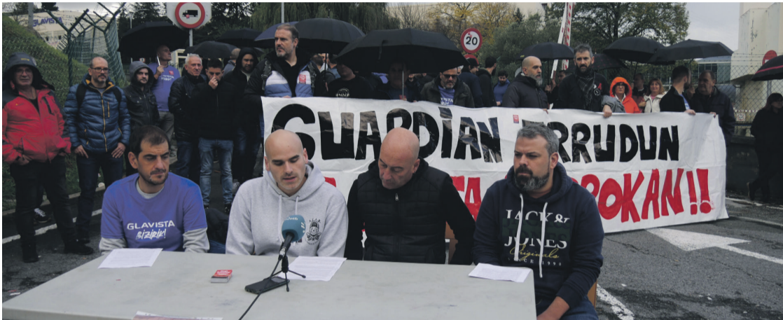
Prentsaurreko bateratua eskaini dute Autoglas-Glavista eta Guardian enpresetako langileek. Aiaraldea.eus