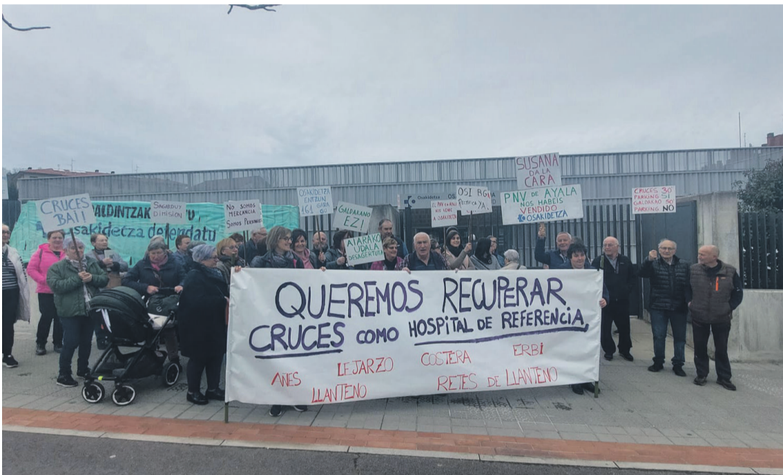
Mobilizazioak egin dituzte Aiarako bizilagunek Gurutzeta erreferentziazko ospitalea izan dadin eskatzeko. Aiaraldea.eus