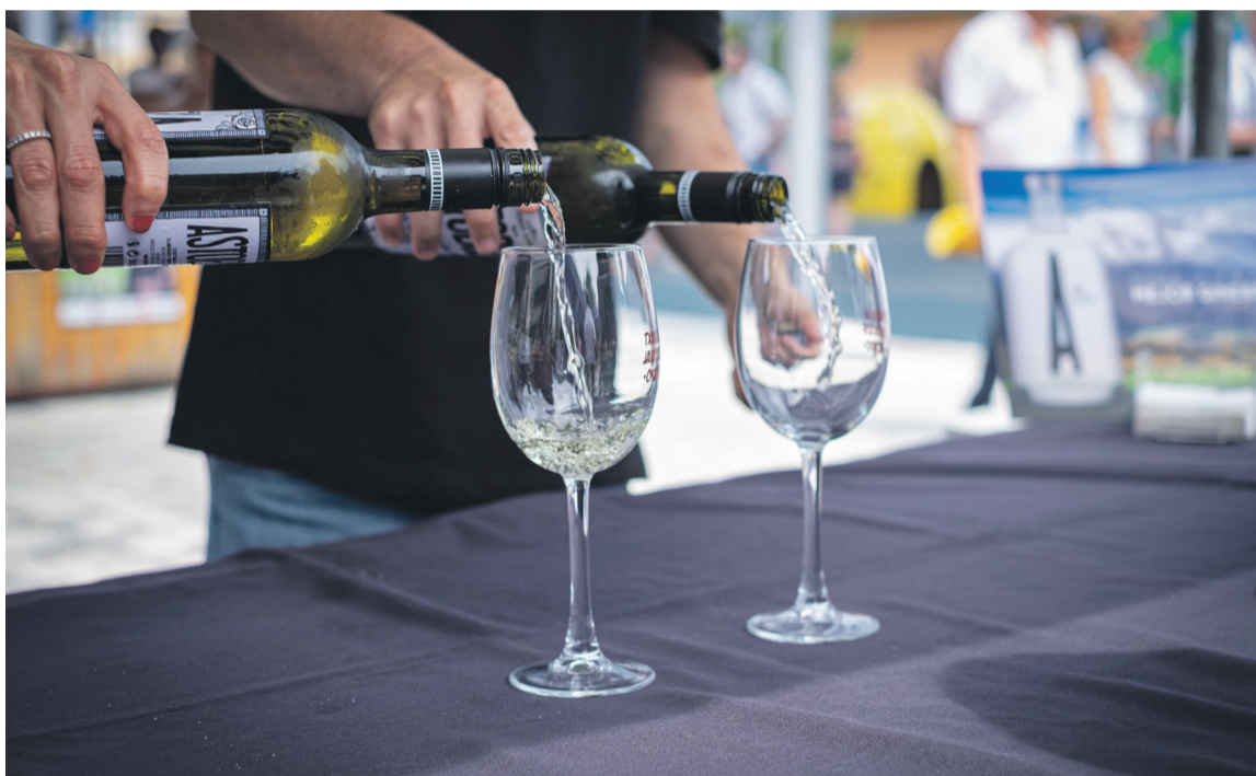
Aurreikusi baino txakolin gutxiago ekoizteko aukera emango du uzta. Aiaraldea.eus