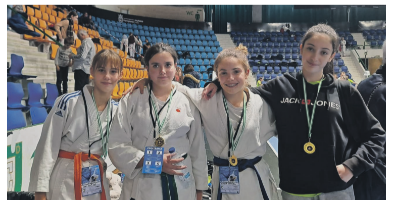
Amurrioko Judo Klubeko kideak.