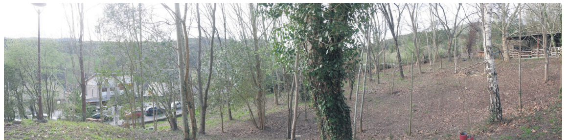
Iragan asteburuan ospatu zuen Kirikiñok Basoa espazioaren bigarren urteurrena.