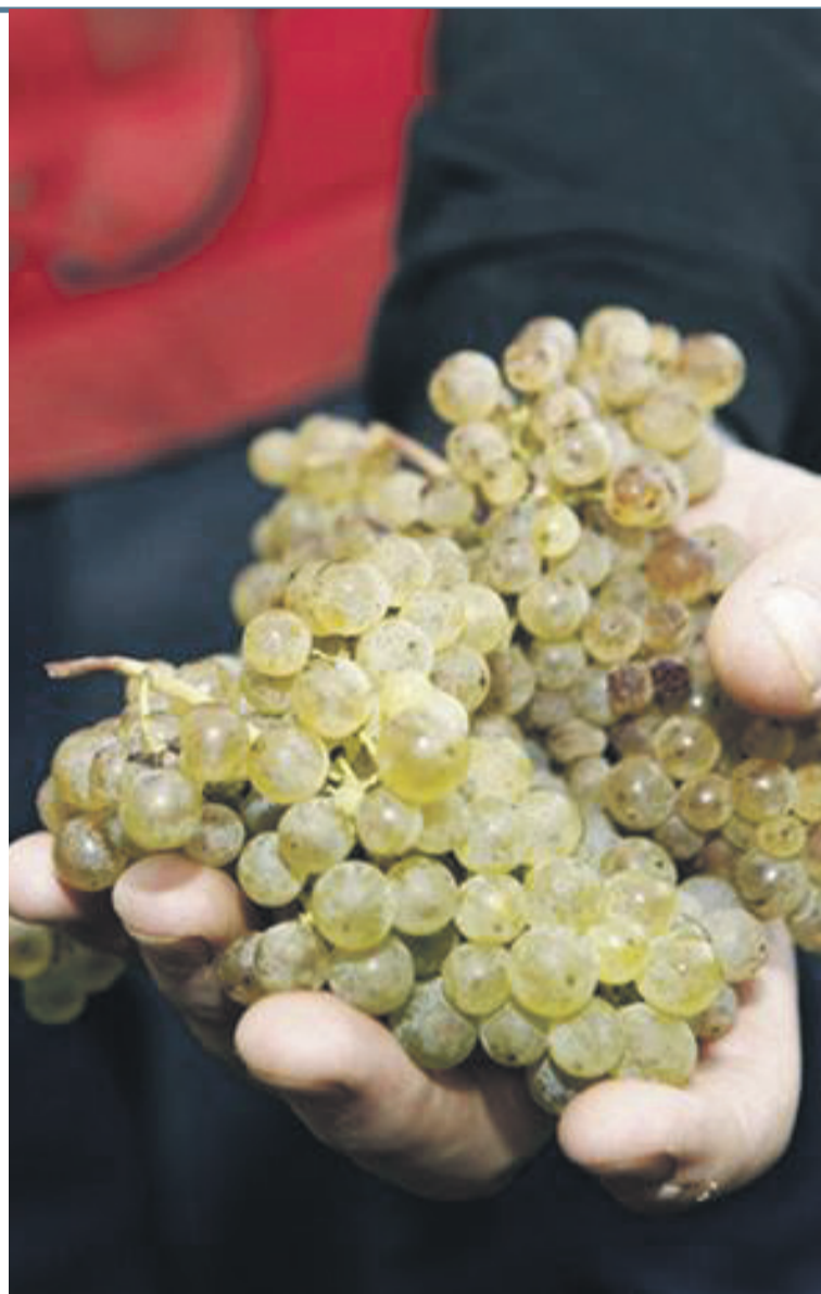
Uztaren kalitatea oso ona izan dela azaldu dute adituek.