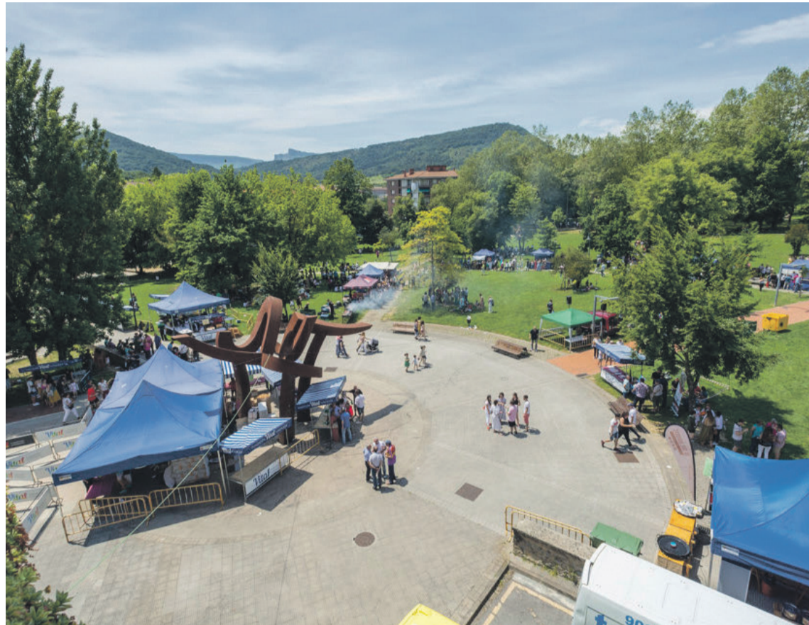
Fasta-giroak Amurrio hartuko du maiatzaren 22an, eta Amurrioko Parkea izango da erdigune. Arabako Txakolina

12:00etan txupinazoa jaurti, eta orduan bai, Juan Urrutia Parkean kokatua egongo den jai-barrutiak atek zabalduko ditu. Arabako txakolinik onena dastatzeko aukera egongo da bertan. Gastronomía eskaintza za-