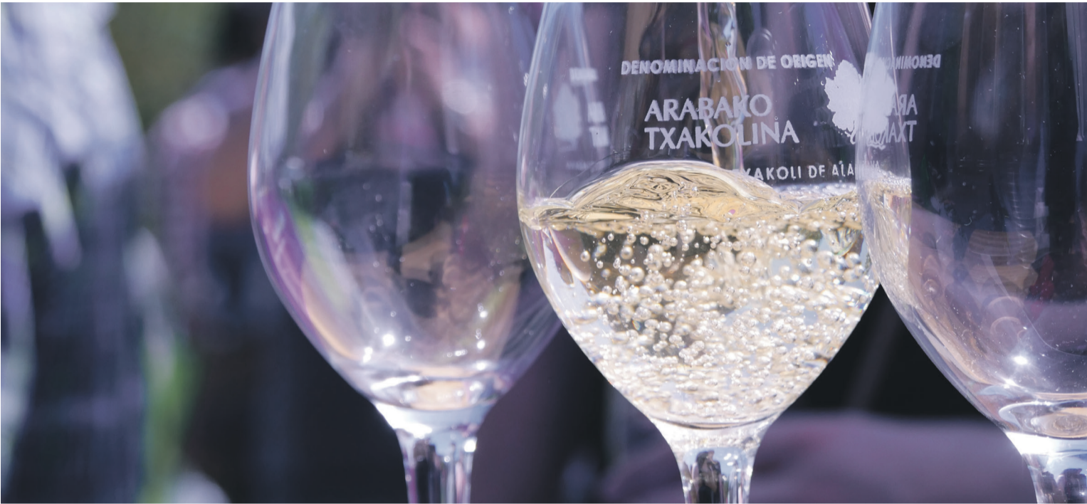
Nazioartean arrakasta handiko edaria da Arabako Txakolina. Aiaraldea.eus